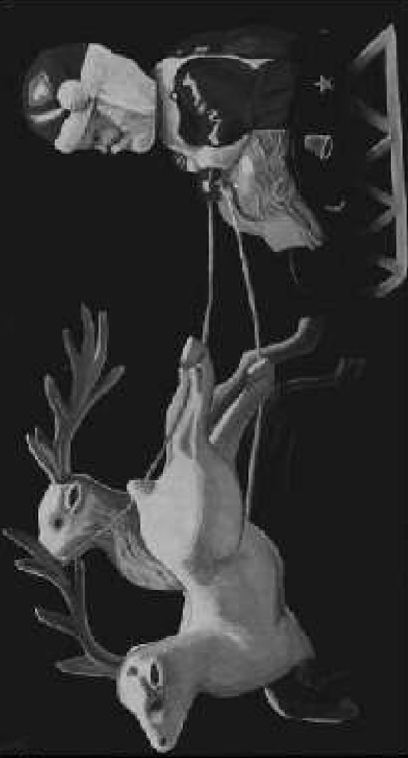
Quintura Navideño Creado por Mushi Muntanabaki